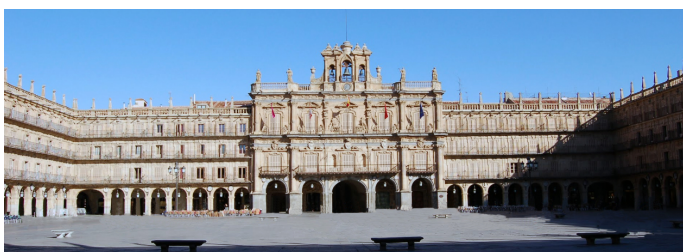
Plaza Mayor de Salamanca